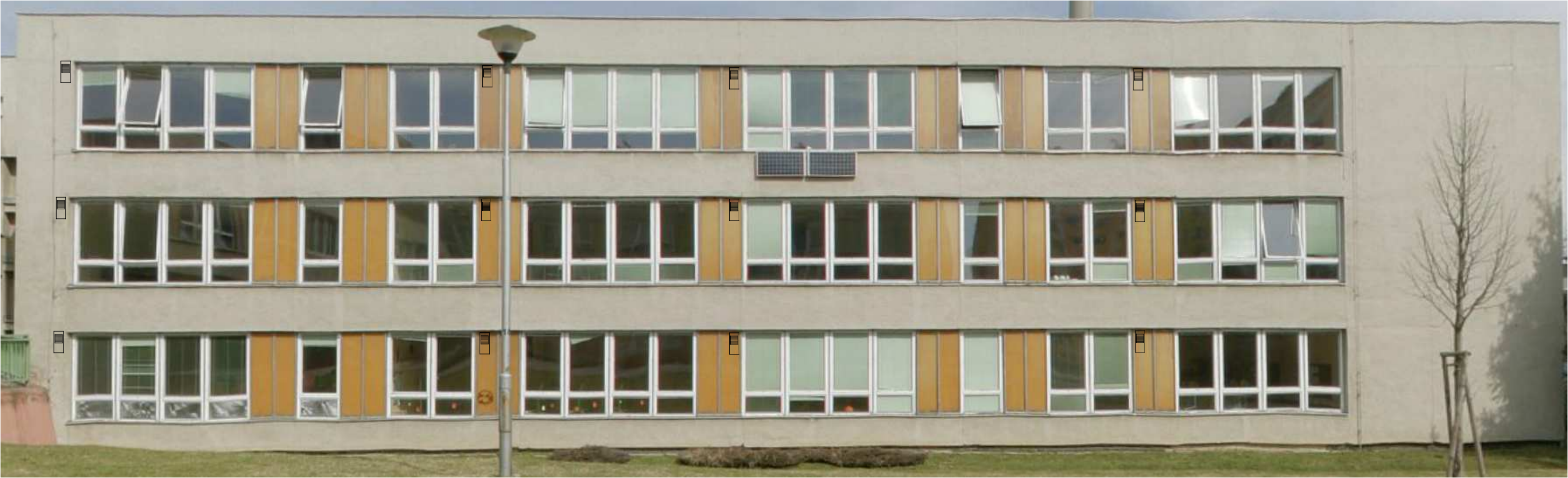
KOMBINOVANÁ VÝÚSTKA VÝFUK A SÁNÍ VZT JEDNOTKY